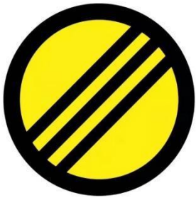
封闭区解除标志牌.，位于终点之后