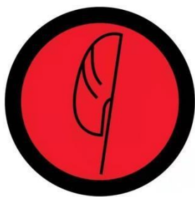
红色卷旗标志牌，位于发车点