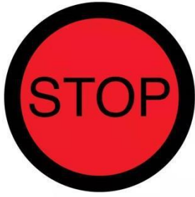
红色终点标志牌.，位于终点