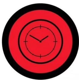
红色时钟标志牌，位于检录点